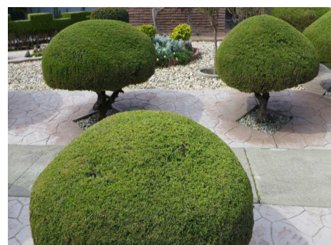
2016年は200件のお庭を剪定させて頂きました♪

自宅の庭木・植木を常に整え、より長持ちさせる為には、プロの剪定がかかせません。自宅のお庭をリフレッシュしたい方は是非御用命下さいませ。