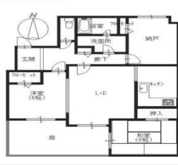
(103号)2LDK+納戸 79.98㎡ 91,000円