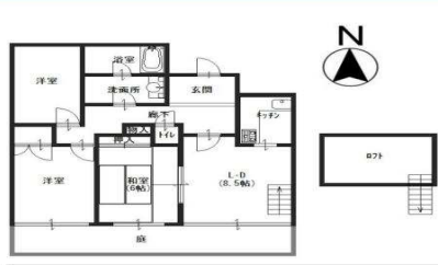
(102号)3LDK+ロフト 91.45㎡ 95,000円